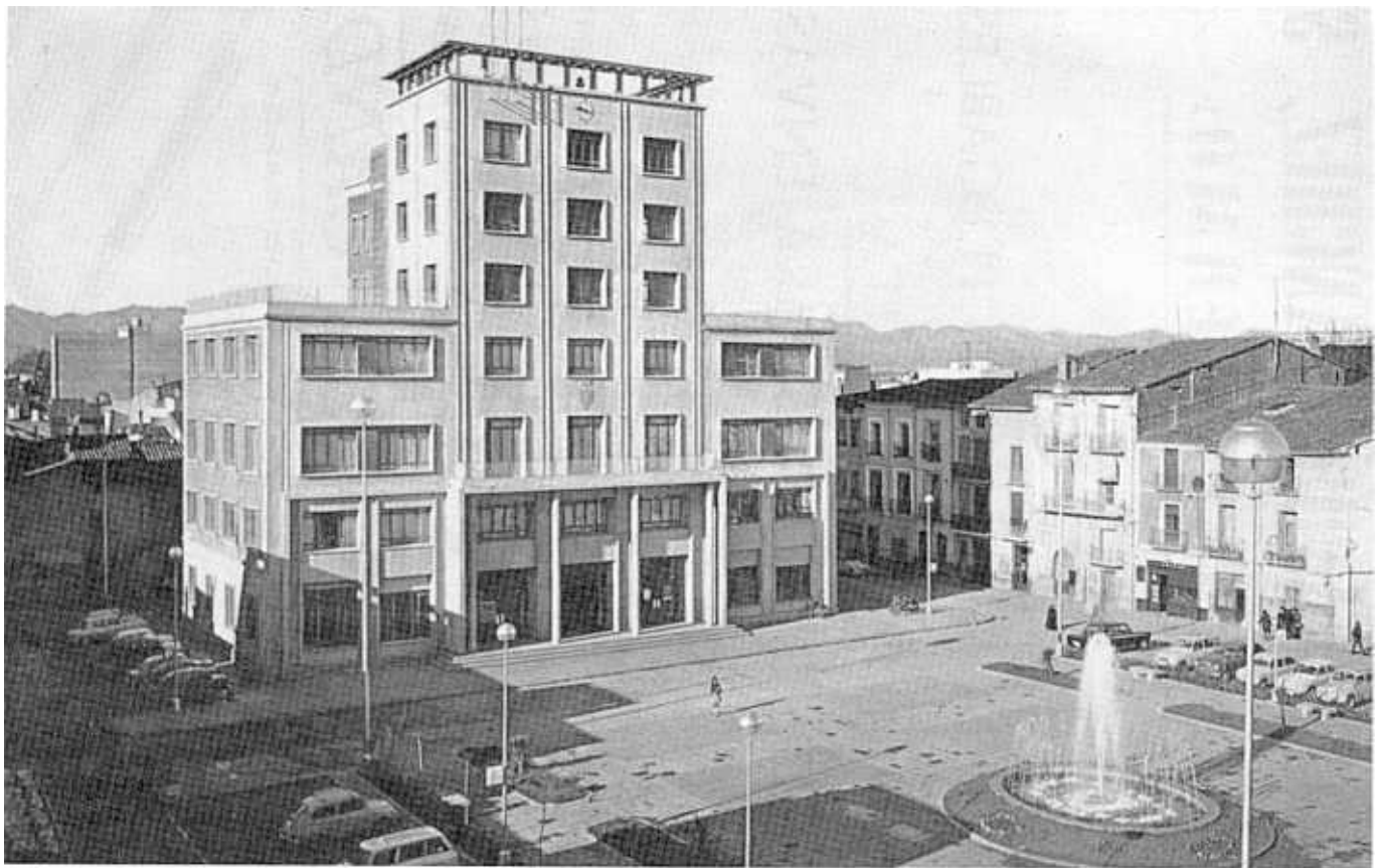
La Plaza Mayor recién inaugurada

nación, mediante faroles de brazo de 7 y 12 metros de altura. En 1974, dentro de los actos conmemorativos de la Fundación de Villarreal, en su VII Centenario, es inaugurado frente al Ayuntamiento, en la parte opuesta, el monumento dedicado al Rey fundador, don Jaime I, en la concesión de la Carta Puebla fundacional. Este monumento, en piedra de colmenar, es obra de Lloréns Poy. La realización de la nueva plaza y Ayuntamiento fue iniciada en 1958. El 16 de julio se adjudicó, a la cuarta subasta, el derribo del antiguo Convento de las Madres Dominicas, denominada del Corpus Christi, por la cantidad de 125.100 pesetas, de las cuales se abonaron 45.000 pesetas a las religiosas dominicas y 80.100 pesetas pasaron a las arcas municipales. El proyecto de urbanización y Ayuntamiento, del arquitecto don Vicente Vives Llorca, fue aprobado en 28 de enero de 1961. En febrero de este año se tramita un préstamo de 3.900.000 pesetas con el Banco de Crédito Local de España para financiar parte de la obra, pagadero en treinta anualidades. En 20 de septiembre de 1962 son adquiridas las casas comprendidas dentro de lo que ha de ser la nueva plaza. La subasta de las obras de la Casa Consistorial es adjudicada definitivamente el 29 de septiembre al contratista don José Marco Polo, por 5.999.352'35 pesetas. Las obras de urbanización y pa-