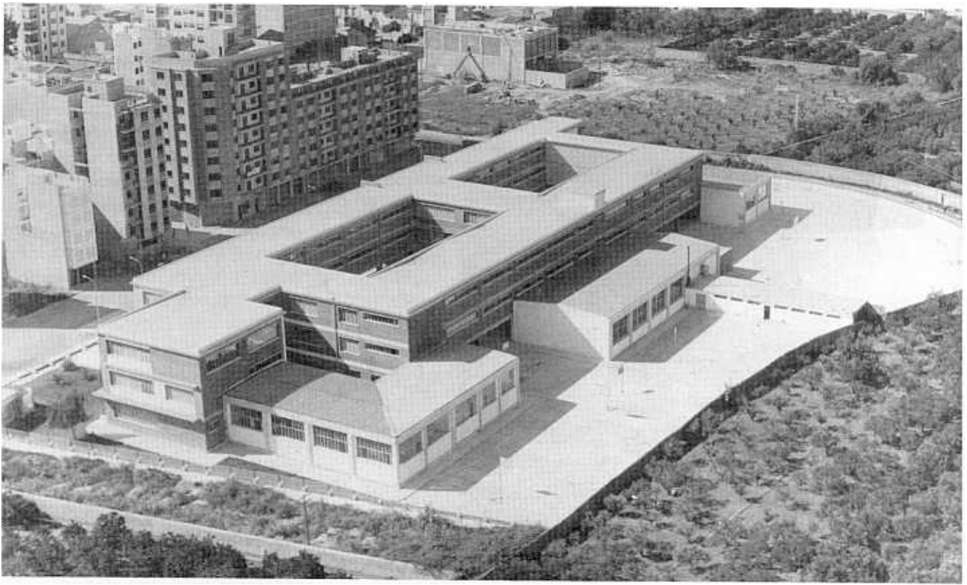
El nuevo Instituto de Bachillerato se perfila como el futuro educativo de la ciudad

acordó conceder una Medalla de Oro a don Camilo Alonso Vega.