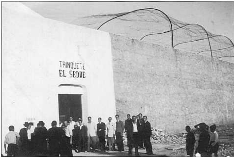
FAÇANA DEL "TRINQUETE EL SEDRE". UBICAT AL COSTAT DE LA SÈQUIA MAJOR.