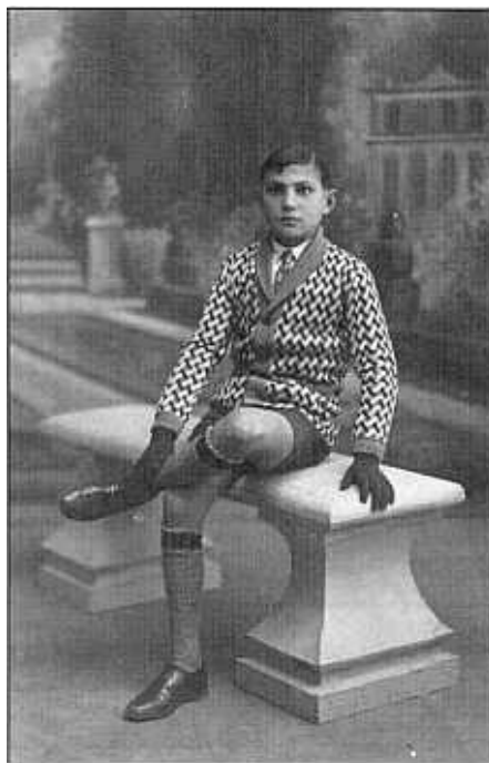
SALVADOR SAGOLS AL 1931