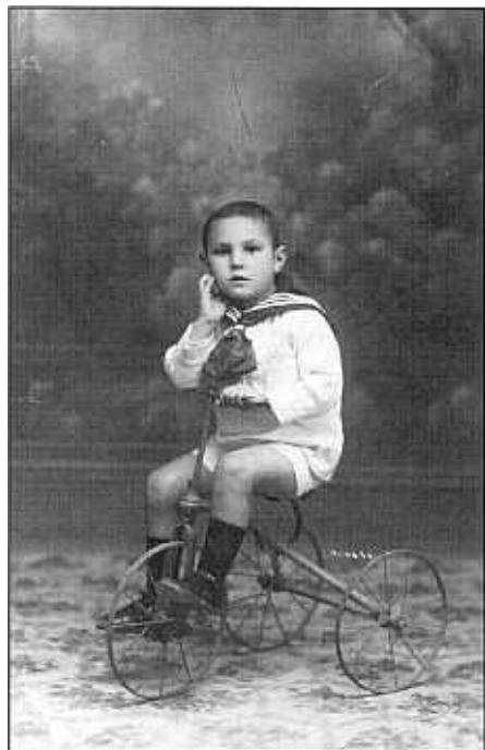
A BORRIANA, ALS TRES ANYS