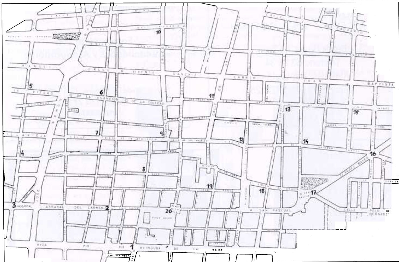
LLOCS PER A L'EMISSIÓ DELS BANS RECORREGUTS PELS AGUTZILS