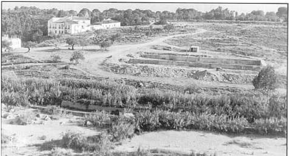
TERMINI ABANS DE LA CONSTRUCCIÓ DE LES PISCINE