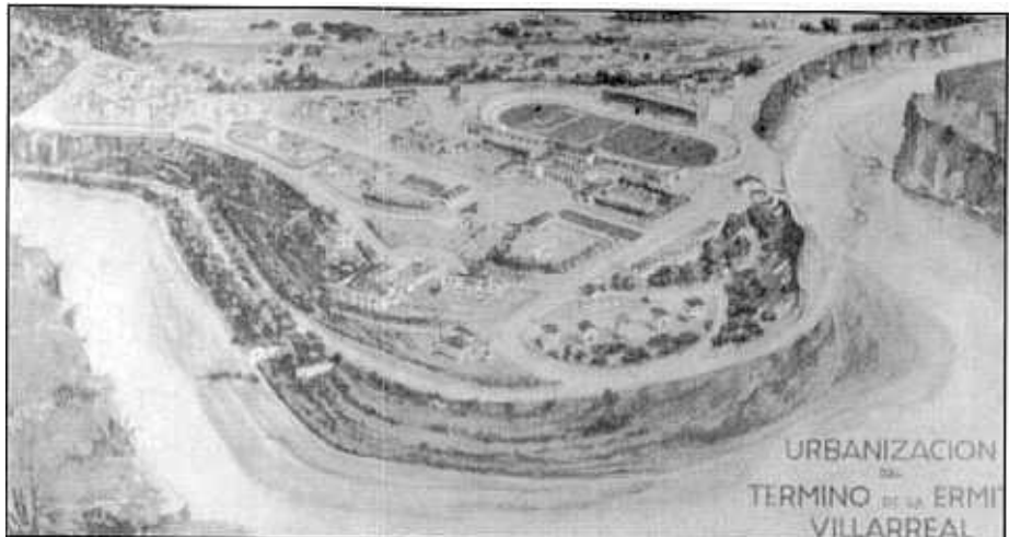
ANORÀMICA GENERAL PROJECTE

2.- Nucli de relacions i vida social. - Format per l'Hotel, Refugi, Cafè, Restaurant, i Sala de festes de l'Hotel, Pavelló i Camps de Jocs, Piscina i Platja Artificial, Pistes per a concursos i exhibicions de Tennis, Vida de relació familiar, Reunions de la joventut, llocs per a xerrades, berenars, passeigs i "discretes" en una paraula vida de "Colònia".